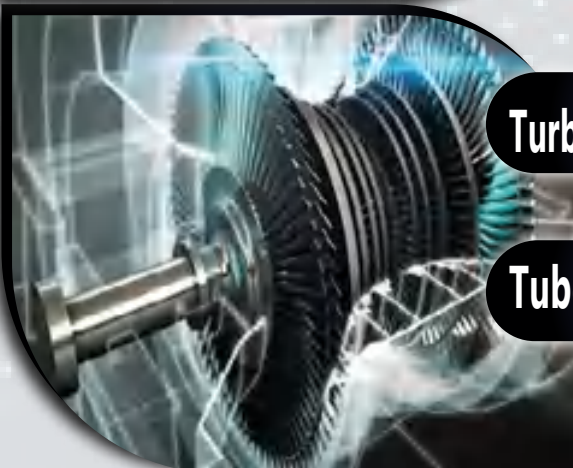
Gas Turbines Parts